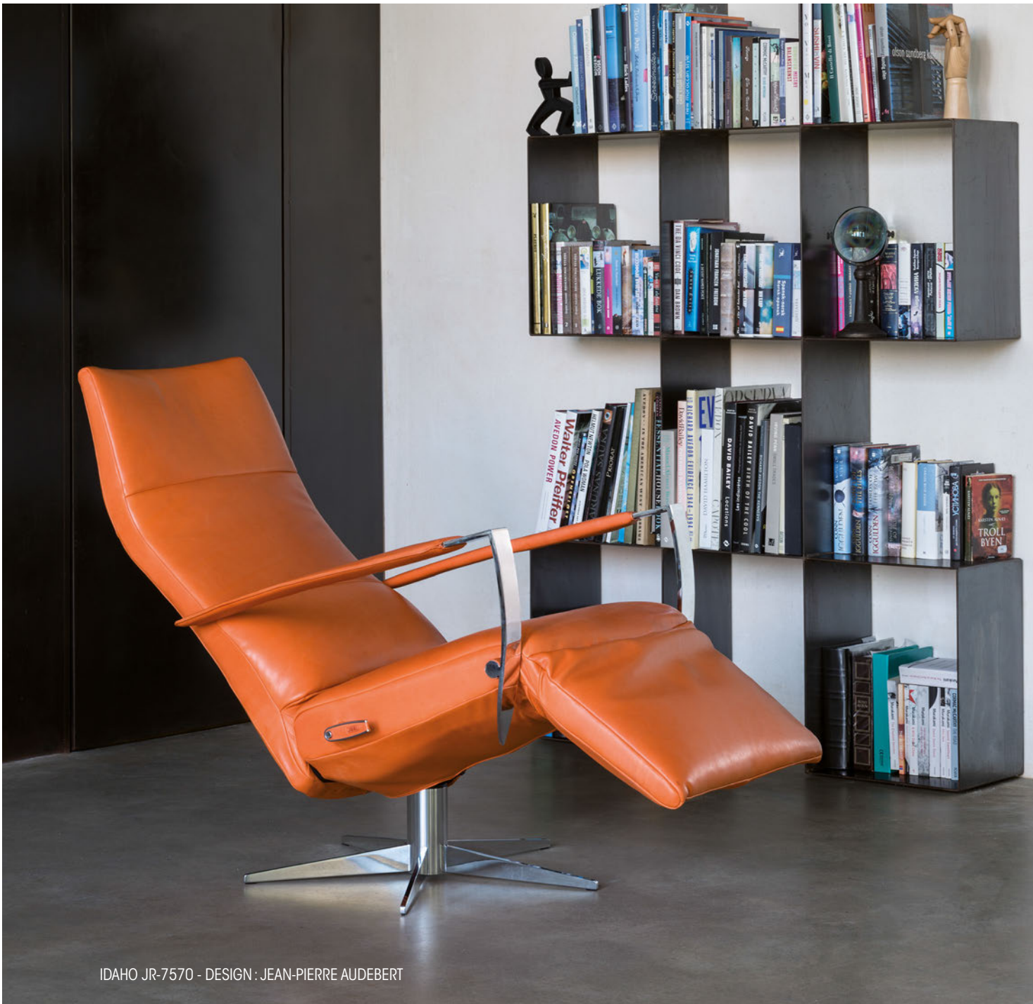
IDAHO JR-7570 - DESIGN : JEAN-PIERRE AUDEBERT